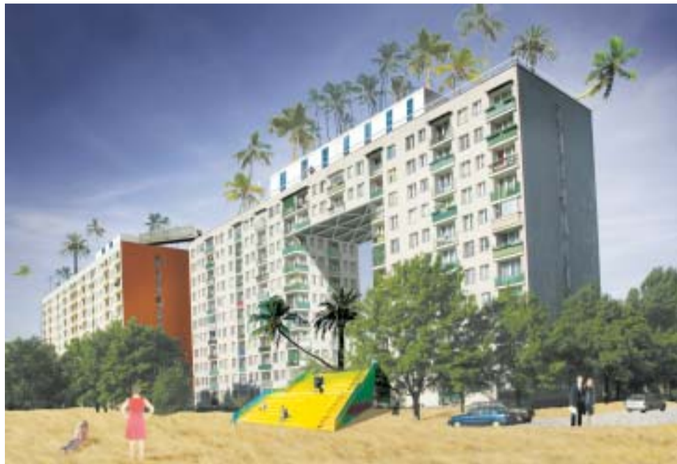
Wizualizacja projektu, zgłoszonego na konkurs na nową wizję bloków na Targówku w rejonie ulic: Złotopolskiej i Orłowskiej.