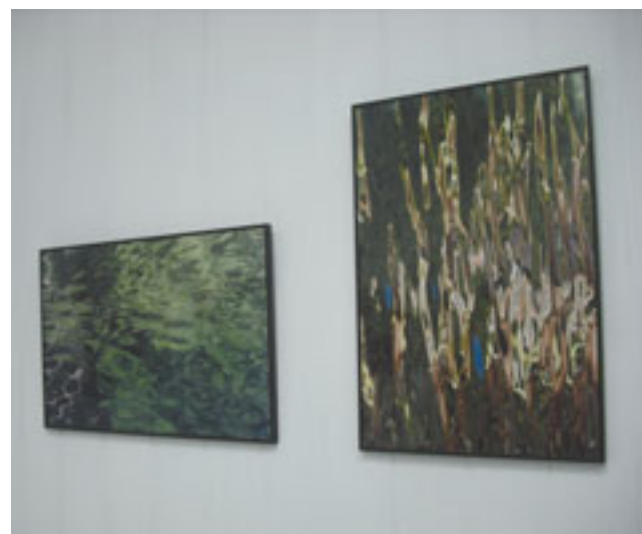
Prace Agaty Czerwińskiej-Szpunar