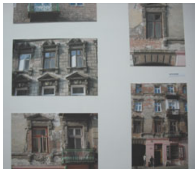
Prace Julity Delbar