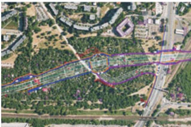
Planowany węzeł z ul. Solidarności/Radzywińska

W rejonie węzła Żaba przewidziano przebudowę istniejących przystanków i torów tramwajowych w celu dostosowania ich do projektowanego układu węzła. Natomiast w rejonie węzła z Trasą Świętokrzyską przewidziano miejsce na lokalizację linii tramwajowej w pasie dzielącym wlotu Trasy oraz wlotu planowanej ul. Nowo Ziemowita.