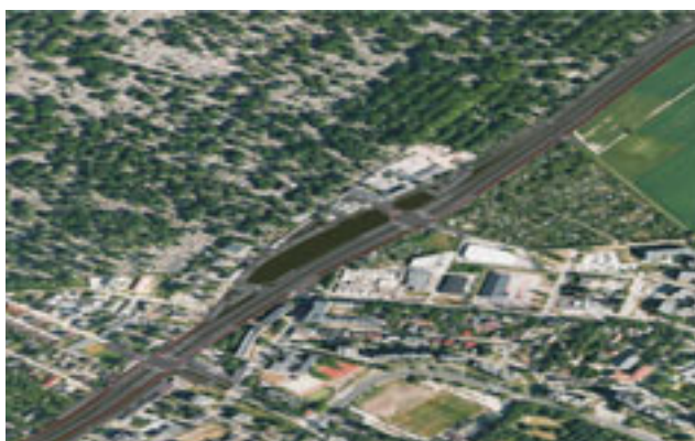
Wizualizacja ul. Św. Wincentego w rejonie Cmentarza Bródnowskiego