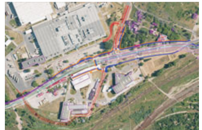
Planowany węzeł „Kozia Górka”