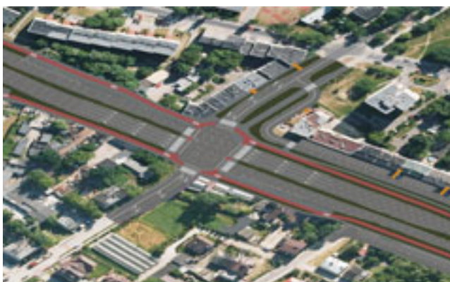
Wizualizacja skrzyżowania ul. Św. Wincentego z ul. Kołową i Obwodową

Opracowanie projektu obejmuje budowę nowej dwujezdniowej ulicy po dwa pasy ruchu w każdym kierunku, budowę skrzyżowań z istniejącymi ulicami poprzecznymi, budowę chodników oraz ścieżek rowerowych. Projekt przewiduje zachowanie rezerwy terenu na linię tramwajową na odcinku od ul. Budowlanej do Trasy Armii Krajowej. W projekcie przewidziano również budowę wiaduktu drogowego w celu bezkolizyjnego przejścia nad ul. Budowlaną oraz bezkolizyjne przejścia dla pieszych w postaci kładek z windami jak i przejść podziemnych.