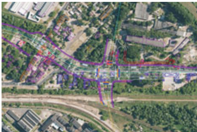
Planowany węzeł z Trasą Świętokrzyską