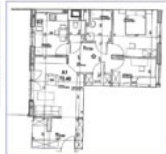
1A – Piękne trzypokojowe (72,1m) mieszkanie na wysokim (półpiętro) parterze z wyjściem na patio, rolety antywłamaniowe w standardzie 6500 PLN za metr kwadratowy