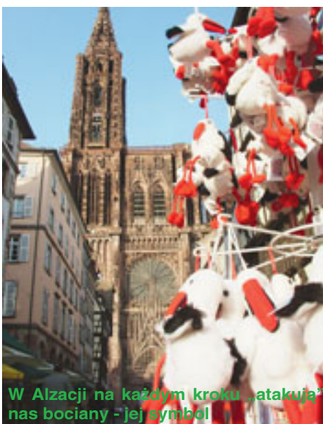
W Alzacji na każdym kroku „atakują” nas bociany - jej symbol