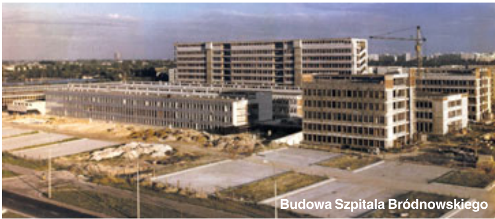
Budowa Szpitala Bródnowskiego