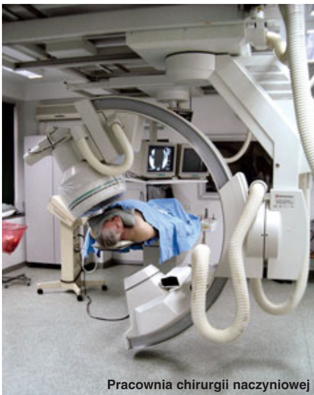
Pracownia chirurgii naczyniowej

- Dziękuję za rozmowę. Rozmawiała Zofia Kochan