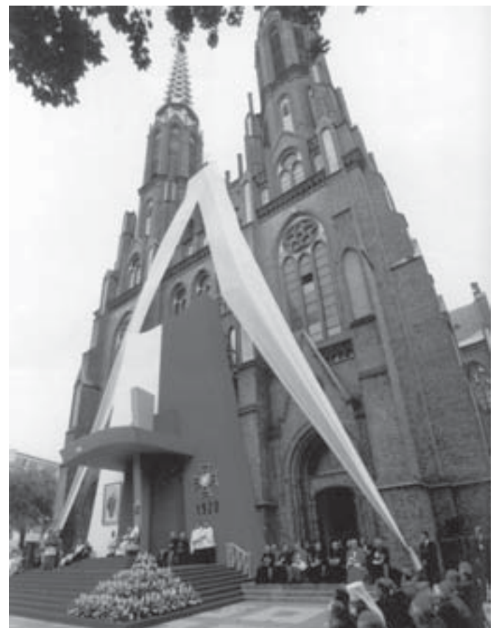
Jana Pawła II w Katedrze Św. Floriana

(Psalm 23/22, Bóg pasterzem i gospodarzem)