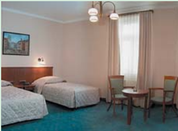
A tak jest.

13 pokojach jednoosobowych, 16 dwuosobowych (z podwójnym łóżkiem – „małżeńskim”) i 39 – dwuosobowych (z dwoma łózkami). Do dyspozycji gości jest jacuzzi. Na parterze mieści się duża, klimatyzowana sala konferencyjna na 100 miejsc, którą w zależności od potrzeb można podzielić na dwie części, wyposażona zgodnie z wymogami XXI wieku. Jest restauracja, kawiarnia i bar.