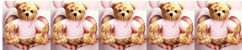
5 sprzedanych misiów daje szansę 1 kobiecie